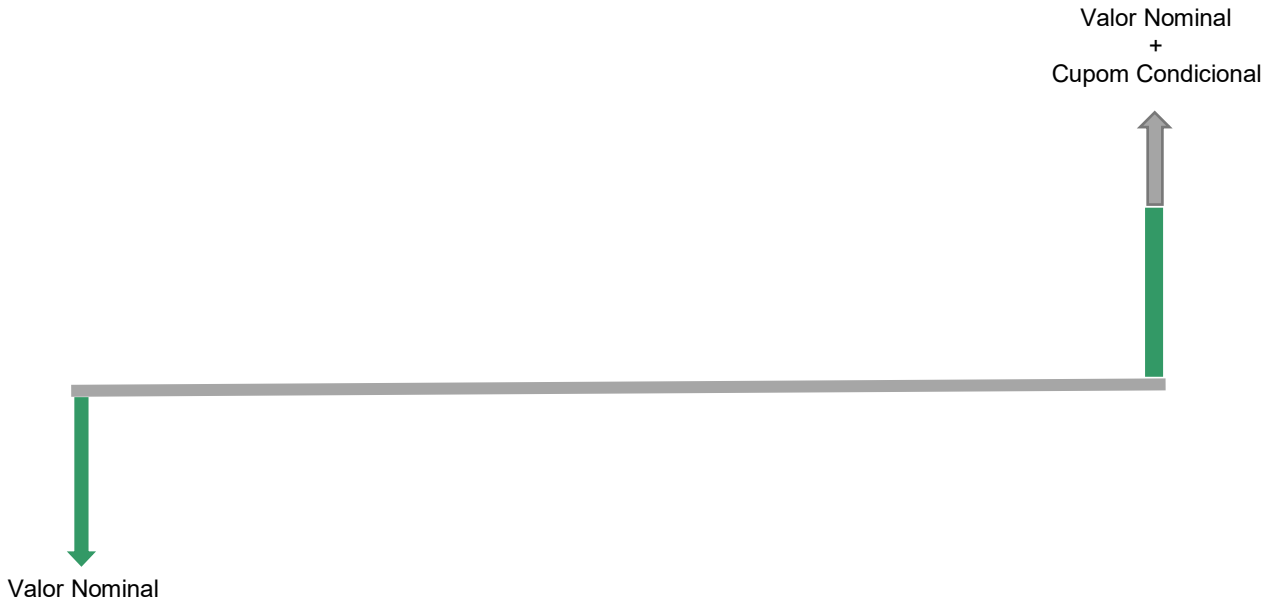
Ilustração de cenários possíveis na Data de Vencimento Final 1

A estrutura paga um Cupom condicional, na Data de Vencimento Final, caso a performance do Ativo Objeto obedeça às barreiras pré-estabelecidas.